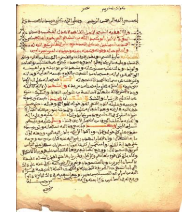
المرشدة نص عقيدة ابن تومرت كانت تدرس في المغرب.