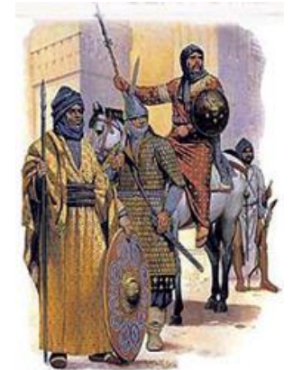
حوالي 1160 قام الموحدين بتوحيد المغرب و الأندلس