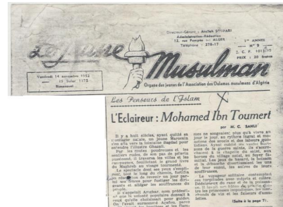
ابن تومرت و الحركة الوطنية - هذا المقال لمحمد شريف ساحلي 1952