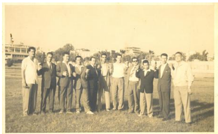
En 1958 à la Conférence de Casablanca, en compagnie de Boussouf, Boumedienne, Krim, Ben Tobbal,...