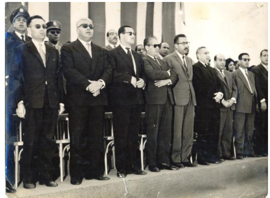
A Tunis lors de l'installation du 2 ème G.P.R.A. On reconnaît le président Ben Khedda, M'hamed Yazid,...