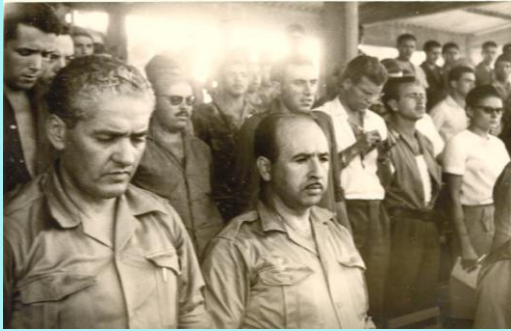
Le Commandant Kaci et Krim Belkacem à Béjaïa le 03 juillet 1962.