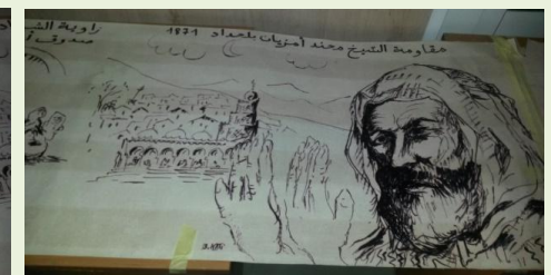
L'épopée de Cheikh Aheddad en plusieurs étapes, avec la mise en avant de sa Zawiyya – Institut de Seddouk ou Fella. Ci-dessous : les célèbres joutes oratoires entre le poète Si Mohand ou M'hand et Cheikh Mohand ou L'Hocine