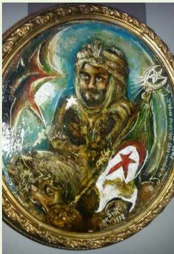
L'artiste accorde une importance particulière à l'histoire du Royaume de Koukou au 16 ème siècle. Ici, le portrait du Sultan Sid Ahmed ou al-Qadi.