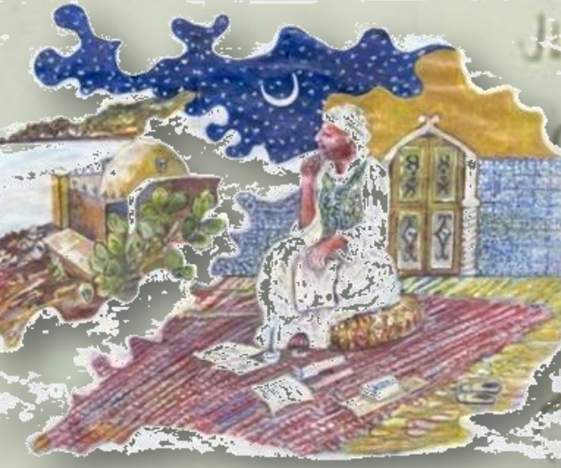
Dessin : Ali Tabchouche