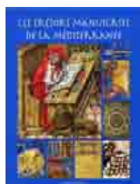
Editions Fatou, Paris, 2005 ISBN : 2-87844-074-9.