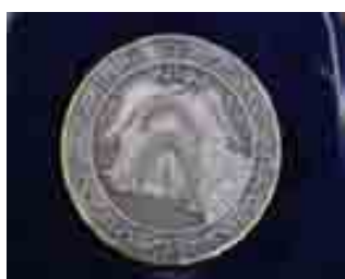
Médaille du 930 e anniversaire, Béjaia, 1997.