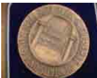
Médaille de l'Université de Pise. 1994.