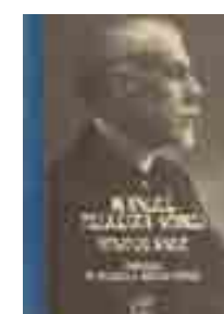
Tinta da China Ed., Lisboa (Portugal), 2010. ISBN: 978-989-671-039-2.