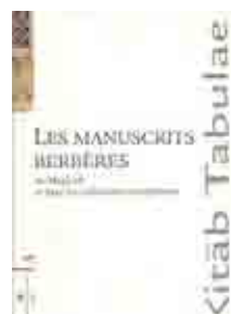
Perrousseaux Ateliers Ed., Paris, 2007, ISBN : 978-2-911220-18-0