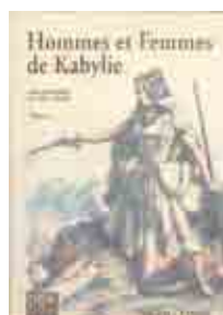
Edisud Ed., Aix-en-Provence, 2001 ISBN :2-7449-0234-9