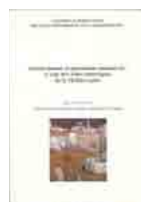
Publisud (Paris) /ISPRM(Rome), 2004. ISBN :2-86600-987-8