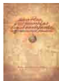
Ayamendo Murcia Ed., Murcia (Spain), 2007 ISBN : 978-84-96760-15-8.