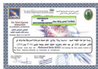
Prix de la meilleure Publication. Constantine 2010