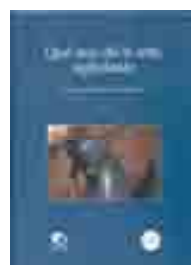
Pacini Editore, Pisa, 2007 ISBN – 10 :88-7781-863-8.