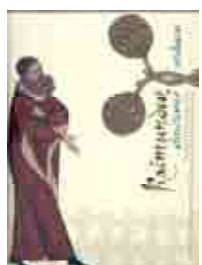
Imed Editions, Barcelone, 2007