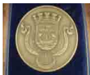
Médaille de la ville de Lisbonne, 1997.