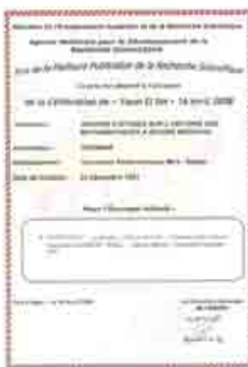
Prix ANDRU 2008