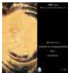
CNRPAH Ed., Alger, 2008, ISBN : 978-9961-716-23-6