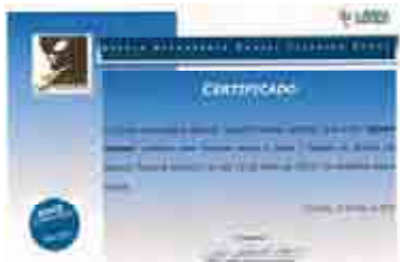
Portimao (Portugal) 2010