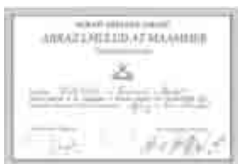
Prix Mouloud Mammeri 1998