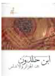
Ibn Jaldun , Entre al-Andalus y Argelia, Legado Andalusi Ed., Grenada, 2007