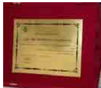
Prix ANDRU 2008, Alger 2008