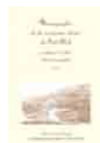
IBIS Press Ed., Paris, 2004, ISBN : 2-910728-45-5